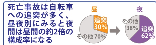
図4：昼間と夜間の、事故類型全体に占める追突による死亡事故の構成率（平成24年～28年：車道）